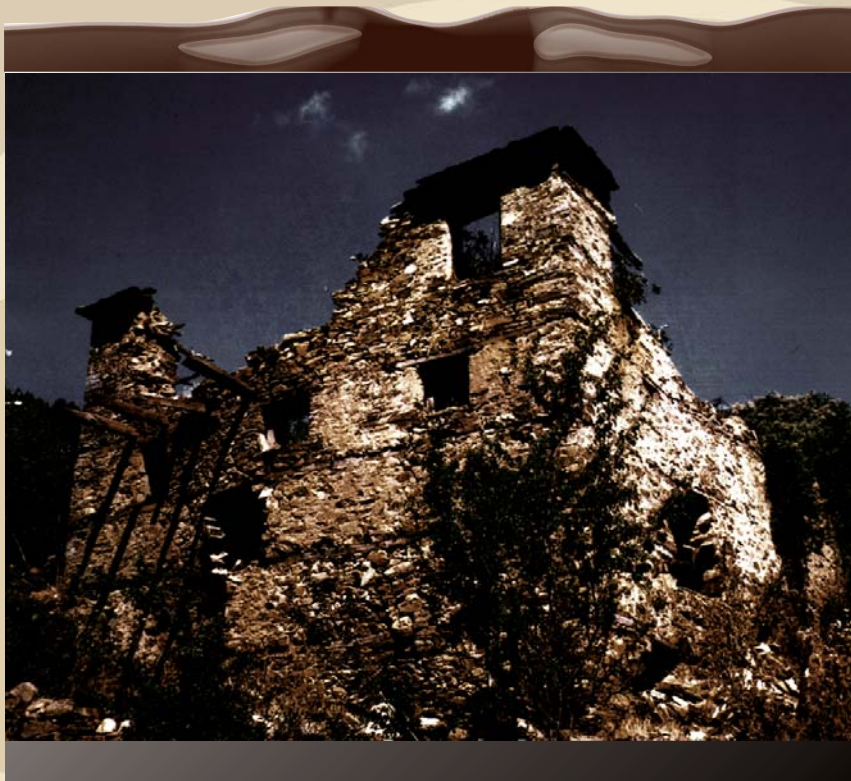
остатоци од селото Бапчор снимени во 1965