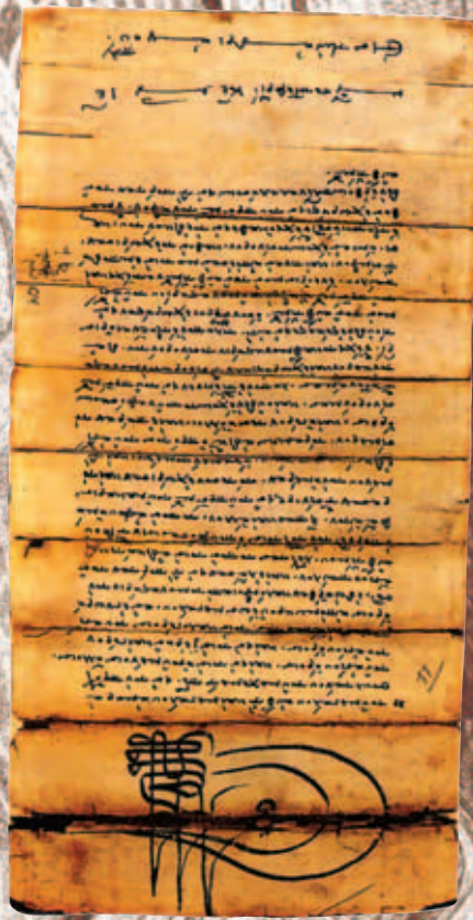
МЕХЕМД II, ФЕРМАН

Во 18 век за 73 години беа сменети 48 Патријарси! Некои од нив беа сменувани дури по петпати, многу од нив беа мачени до смрт. Беа осквернувани цркви, уништувани мошти и Свети Дарови. Погромите на христијаните стануваа сè почеста појава. Во 19 век Турција просто се распаѓаше. Таа „личеше на пациент когашто Европа, плашејќи се од Русија, на сите можни начини го одржуваше во живот“.