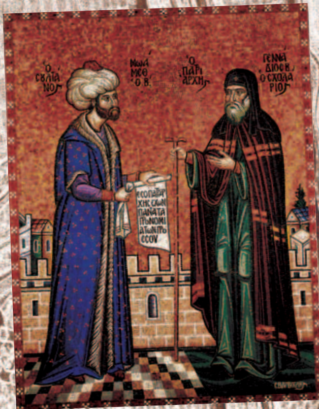
Генадиј Схоларис и Мехмед Втори, мозаик

ИСТ ОРИ С КИ ОТ ПАТ НА ПРА ВОС ЛАВ ИЕТ О