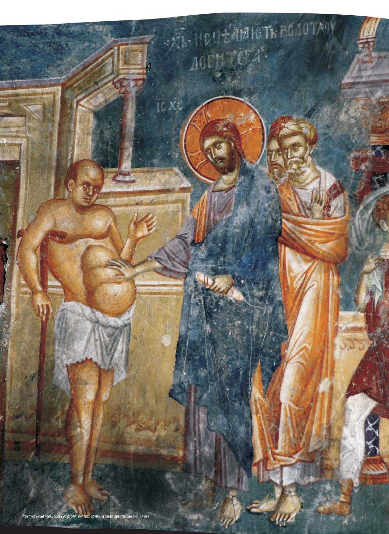
Исцелување на човек болен од водена болест, црква на свети Никита, Бањани, 14 век