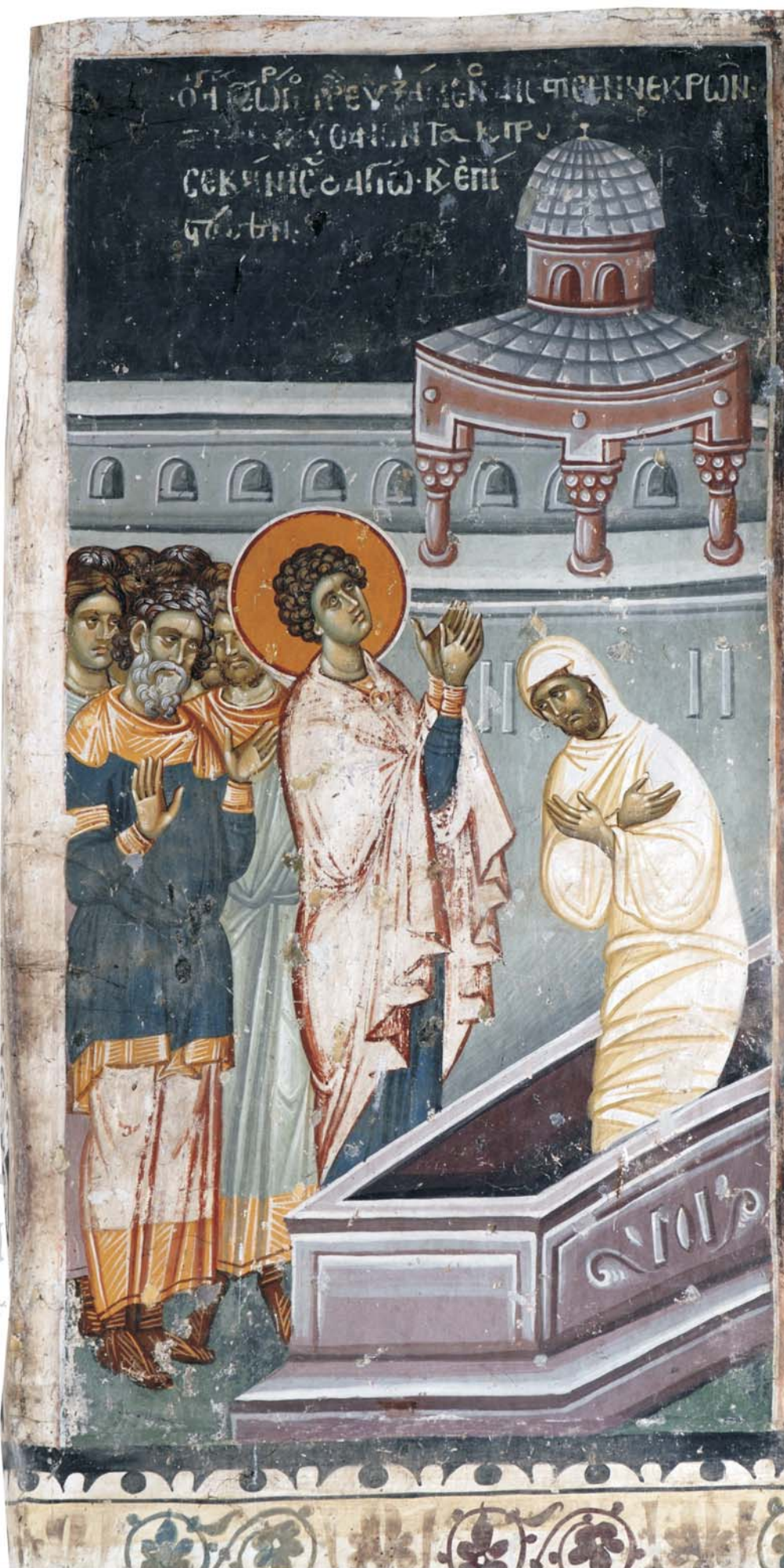
Свети Георгиј, Старо Нагоричане, 14 век